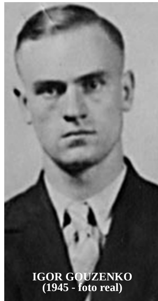
IGOR GOUZENKO (1945 - foto real)

Llegados a este punto dejamos completamente al gusto de los Cazadores (y al tuyo como DJ) la resolución final de la historia. Puede que simplemente piensen en destruir los papeles. Puede que quieran convencer a Igor de lo que pasa, y negociar algo con el (suerte), o simplemente puede que piensen en usar las gafas para ver cuales de los papeles están infectados (solo 5 hojas en concreto) para sacarlas del maletín. O puede que piensen en simplemente matar a Igor y quemar los papeles en el fuego de la explosión.